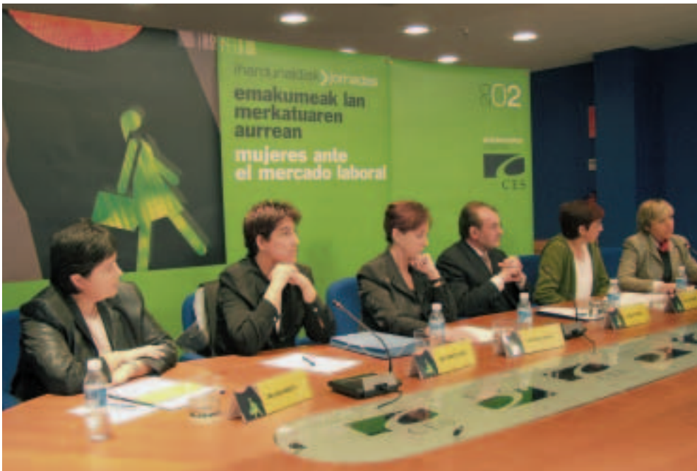
Jardunaldia zela-eta emandako prentsaurrekoaren irudia.

Euskadiko EGBk Emakumeen EAEko lan egoeraren inguruan eztabaida publikoa antolatzeari beharrezko iritziz zion, urteko txostenean gaia jorratu ondoren Batzor-