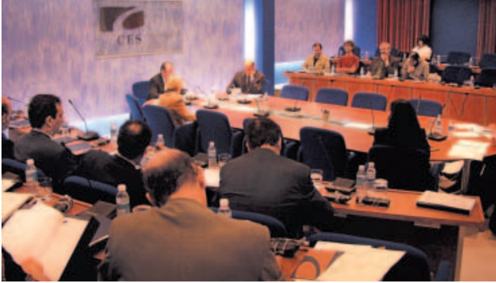
Euskadiko Ekonomia eta Gizarte Arazoetarako Batzordearen ohiko Osoko Bilkura.