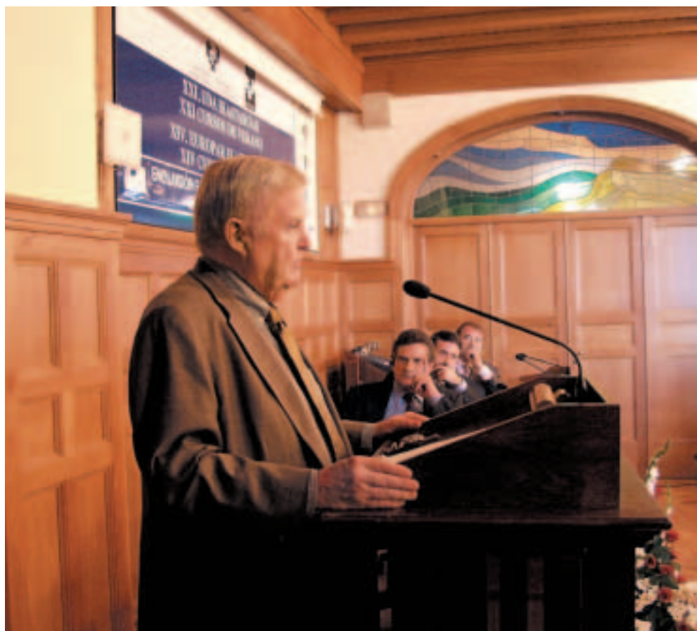
Ekonomia Nobel Saridun Robert Mundell hasierako hitzaldian.