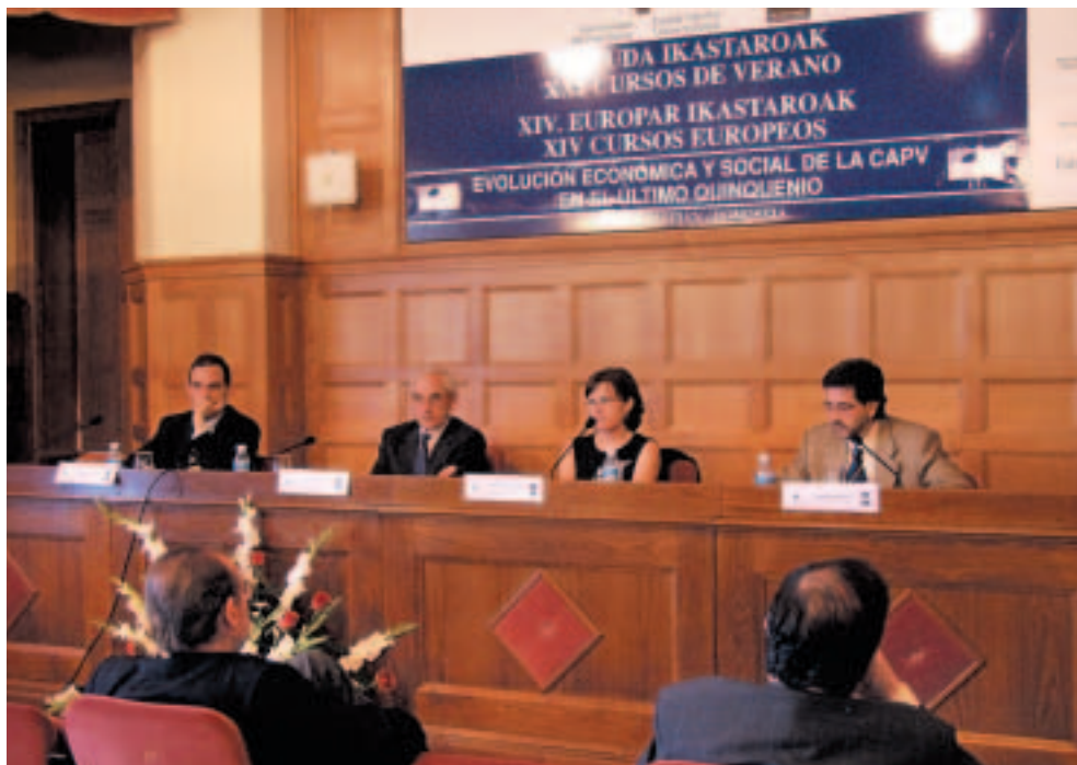
3 mahaingurua: "Lan Merkatuaren Bilakaera EAEn".