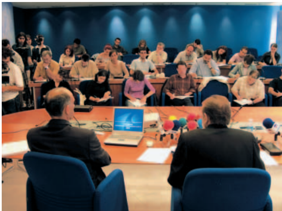
2001eko Urteko Memoria aurkeztu zeneko prentsaurrekoaren argazkia.

Urte txosten honetan Euskal Autonomia Erkidegoan dagoen gizarte eta ekonomia egoerari buruzko daturik garrantzitsuenak aztertzen dira, eta EGBk ordezkatzen dituen talde eta erakunde ezberdinek ados jarritako eta kapitulu deskribatzaileak aurretik aurkeztutako ondorioak, iritziak eta proposamenak azaltzen dira.