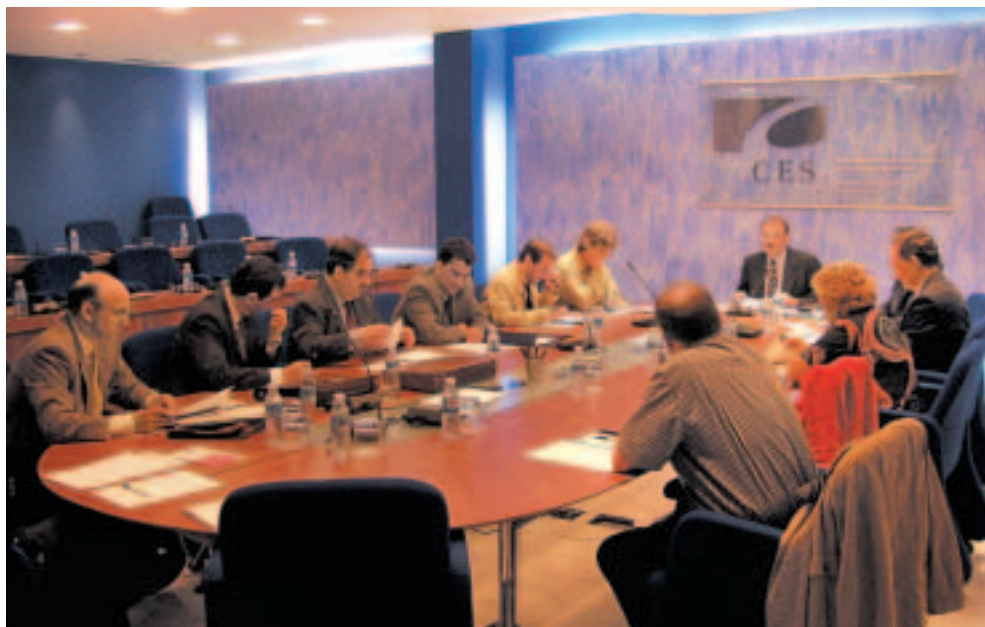
Batzorde Iraunkorraren lan bilera.