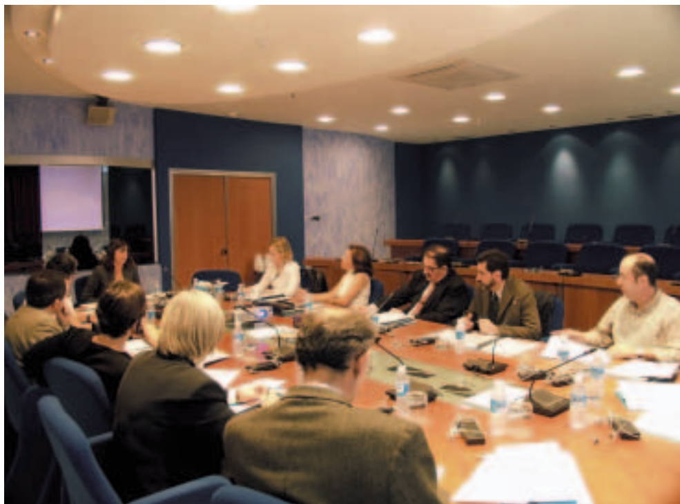
“Auzolan”: Adituen agerraldia Euskadiko EGBren Gizarte Batzordearen aurrean.