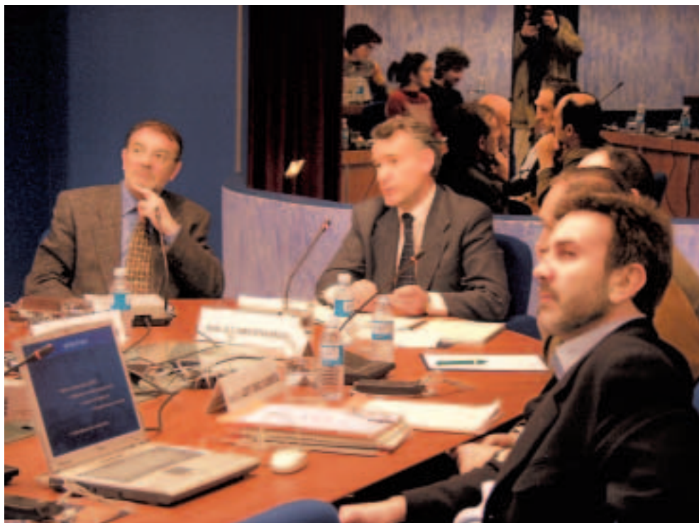
Ingurumen eta Lurralde Antolamenduko Sailburua bere agerraldian.

kontsulta buelta bat zabaltzea, eztabaidagai zegoen lege aurreproiektuak zuzenean ukitutako kolektiboen iritzia jakiteko.